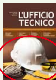
Immagine in copertina + doppia redazionale euro 5.000