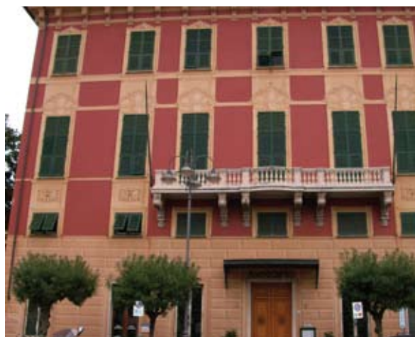
Palazzo Franzoni del Comune di Lavagna

Da oggi l'URP del Comune è in grado di interfacciarsi con i cittadini, le imprese e gli altri uffici comunali: il software IRIDE infatti consente all'operatore dello sportello di accedere all'intera rete informativa comunale, di verificare lo stato di avanzamento delle pratiche, di fornire informazioni utili su procedure, di rilasciare certificati. Inoltre, il software IRIDE di Maggioli Informatica consente di gestire in modo informatizzato il Servizio Segnala-